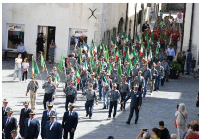
L'ingresso della Sezione ANA di Treviso in Piazza Municipio.