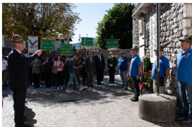
La deposizione della corona.