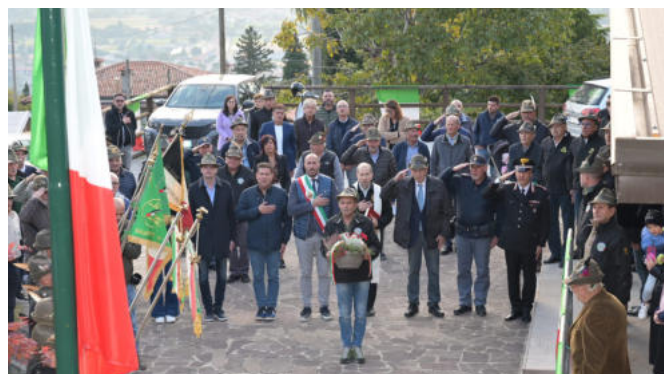
L'omaggio agli Alpini soci della Sezione, andati avanti, il 6 maggio 1976