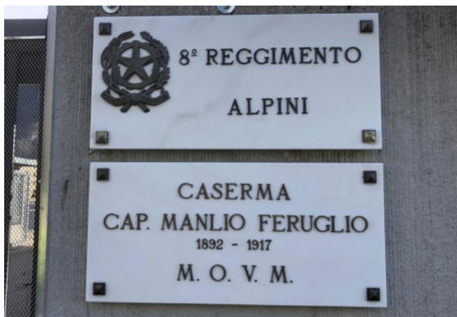
La nuova lapide dedicata al Capitano Feruglio.