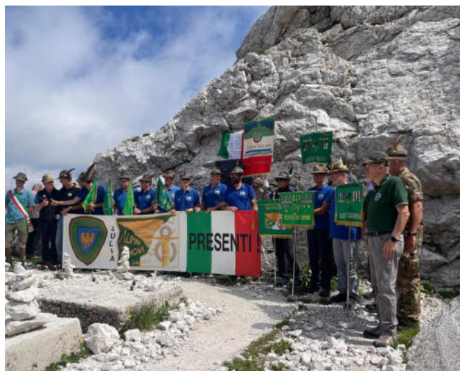
Lo striscione del Gemona a Sella Bila Peč con i Vessilli.

Al termine delle cerimonie, è iniziata la discesa verso la telecabina vicino al Rifugio Gilberti e si è raggiunto il piazzale a Sella Nevea, dove i maestri di sci di quella località avevano preparato un gustoso rinfresco.