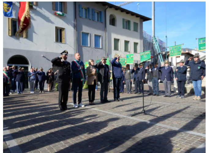
Le autorità rendono omaggio al cippo del centenario.