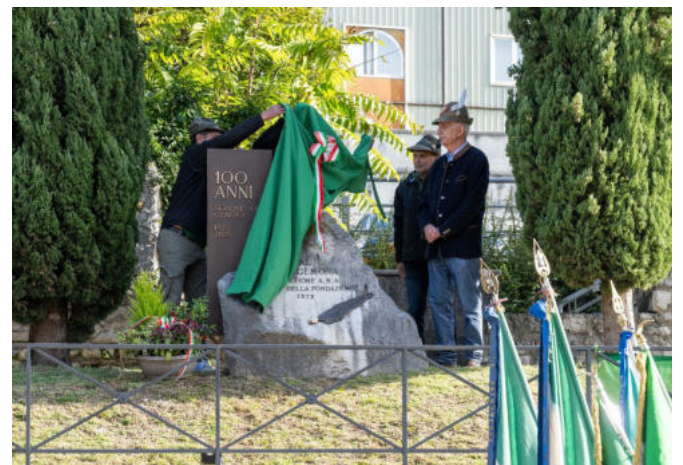
Lo scoprimento del cippo del Centenario.

il legame tra Gemona città alpina e la Sezione ANA e ha confermato l'impegno dell'amministrazione comunale per il sostegno al grande evento, il Raduno del 3° Raggruppamento ANA (Triveneto) a Gemona nel 2026 in occasione dei 50 anni del terremoto.