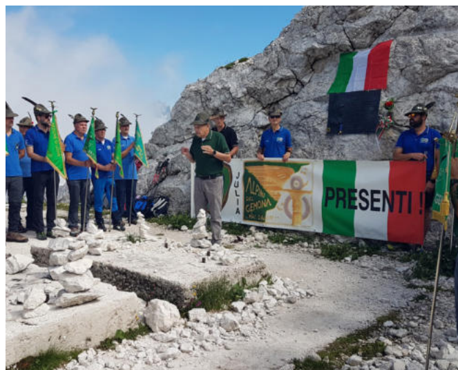
L'intervento del Presidente Ivo Del Negro.