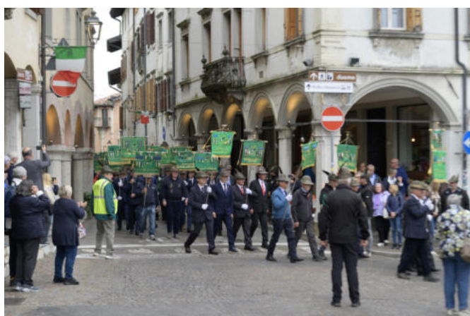
I Vessilli arrivano in Piazza del municipio.