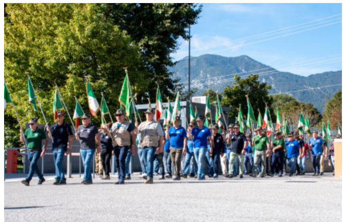
L'ingresso alla caserma Ferruglio dei gagliardetti.