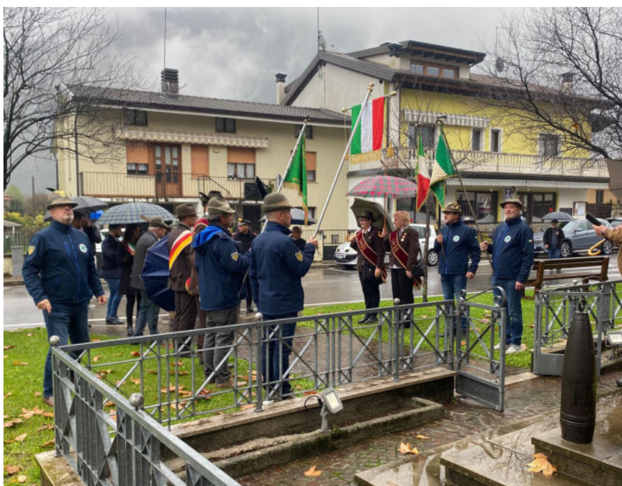
Un momento della cerimonia davanti al Monumento ai Caduti di Alesso.