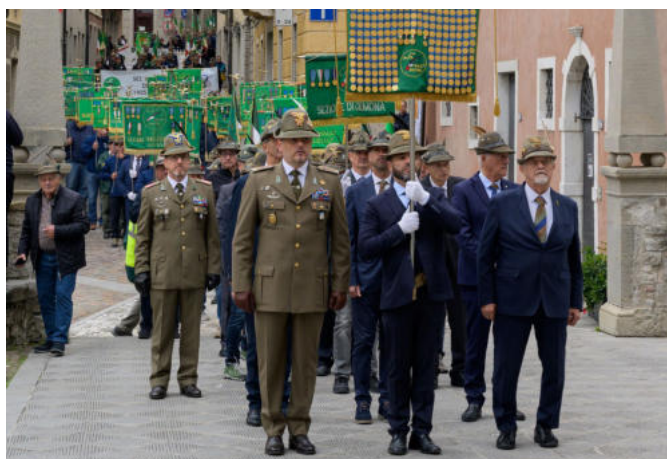
Le autorità e il Medagliere sul sagrato del Duomo di Gemona.