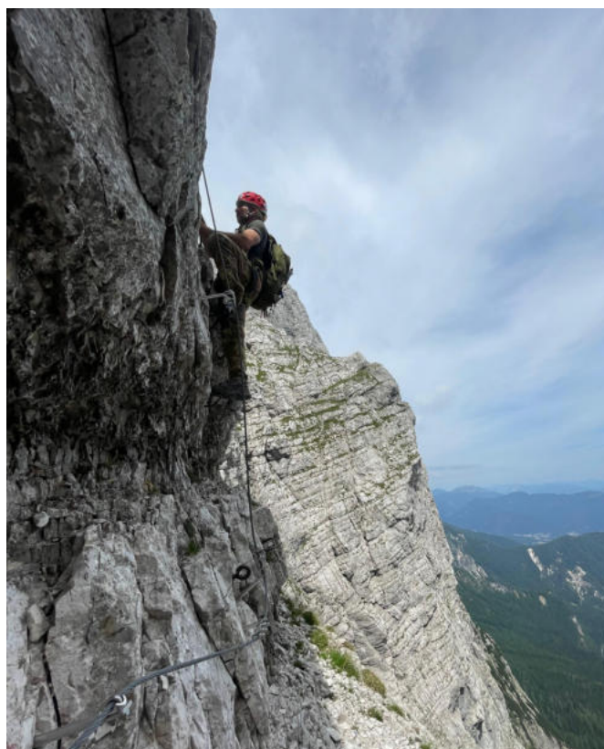
Tratto in esposizione sulla via della vita.