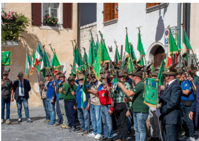
I gagliardetti al termine della sfilata.