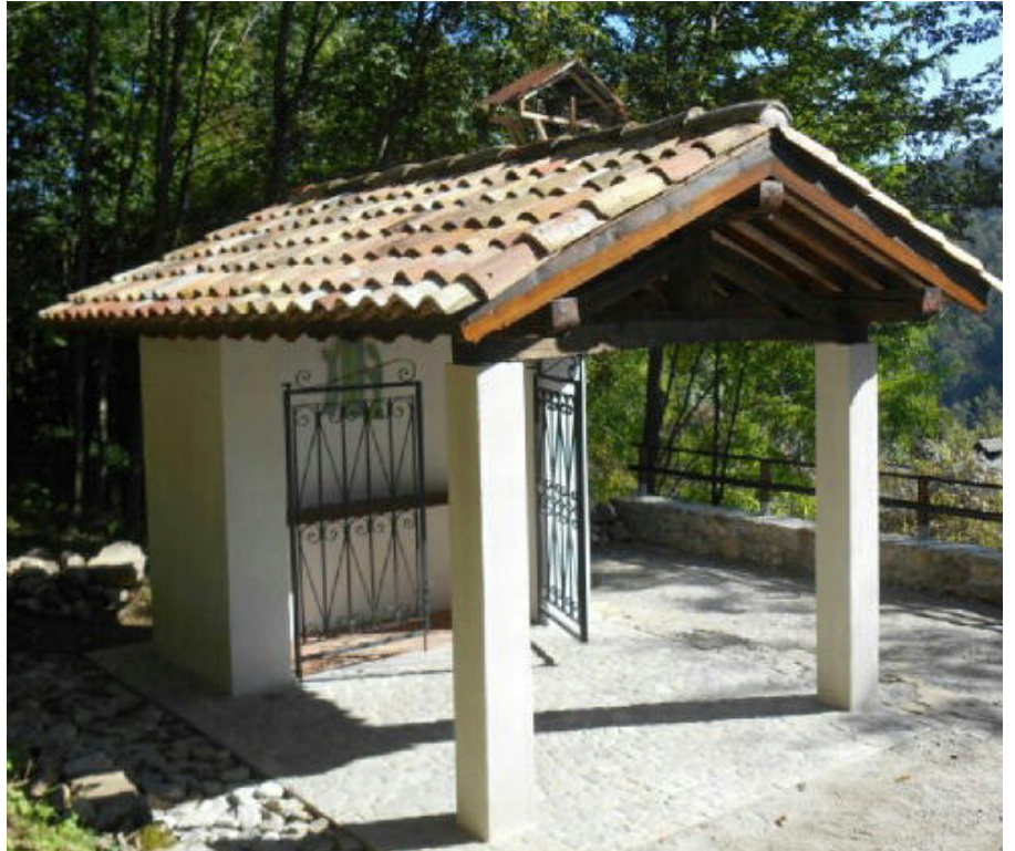
La chiesetta di Plazzaris.

Nella chiesetta di San Michele si svolgevano le Rogazioni, la recita del Rosario durante il mese di maggio, la tradizionale festa di San Michele a settembre. Quest'ultima era una vera giornata di festa, fatta di canti e balli, naturalmente dopo la funzione religiosa, una ricorrenza che richiamava la gente da Montenars e non solo. Così ci hanno raccontato qualche anno fa gli ultimi abitanti di quel borgo ed è così che noi alpini del Gruppo Artegna-Montenars desideriamo far rivivere quelle antiche tradizioni seppur rivestite di un manto nuovo, ma che conservano il cuore di un tempo. I nostri Padri ci hanno insegnato a prenderci cura delle cose più preziose, tracciando la via. Noi, ora, figli di quella generazione che ha cucito sapientemente il tessuto della nostra identità, abbiamo il doveroso compito di preservarlo dall'incuria del mondo. Con questi sentimenti il Gruppo alpini di Artegna-Montenars ha rinnovato l'appuntamento con la festa di San Michele a Plazzaris di Montenars. Domenica 28 settembre, presso la chiesetta, è stata celebrata la Santa Messa da padre Aldo degli Stimmatini. Molti i