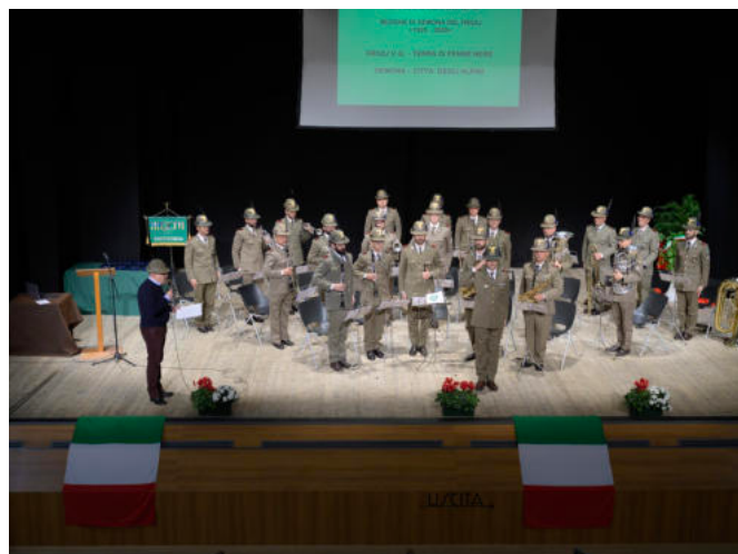
L'esibizione della fanfara Brigata Alpina Julia