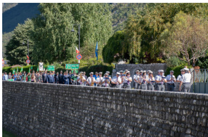
La sfilata lungo le mura.