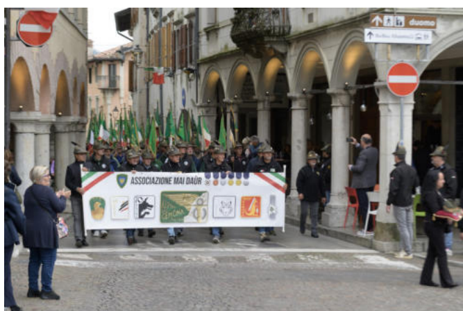
Il corteo in via Bini con lo striscione del "Mai DaÛr".