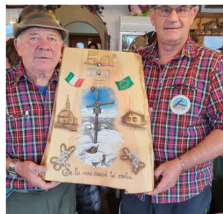
L'incontro con gli Alpini di Valecetta.