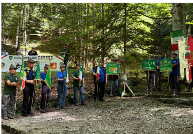
I Vessilli e gagliardetti presenti alla cerimonia.