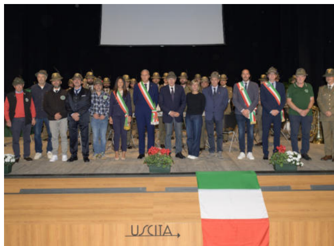
La foto ricordo con i sindaci, i capigruppo e i consiglieri sezionali.