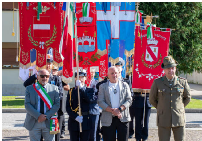
L'ingresso della bandiera del Comune di Osoppo e dei gonfaloni.