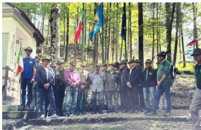
Il coro ANA di Gemona che ha cantato la Messa.