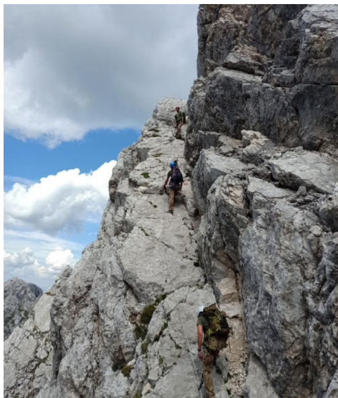
In prossimità della cima dello Strugova.