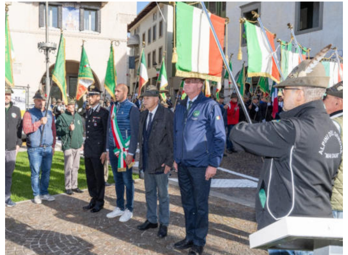
L'omaggio ai caduti in Piazza Municipio a Gemona.