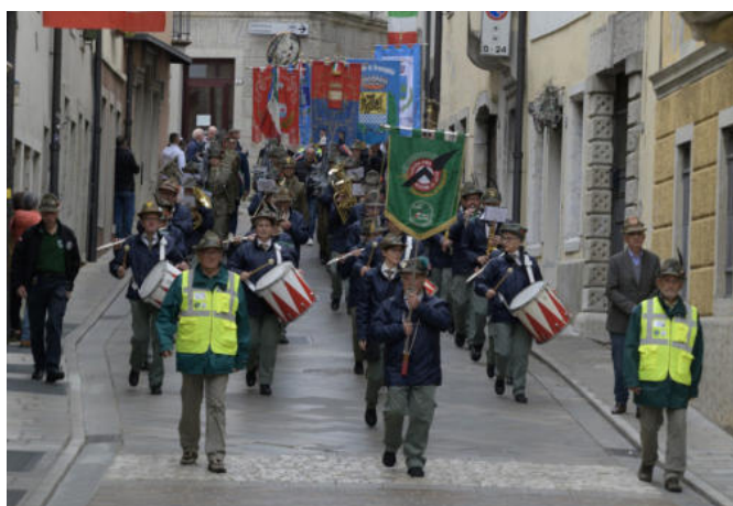
Il corteo lungo via Bini, verso il Duomo di Gemona.