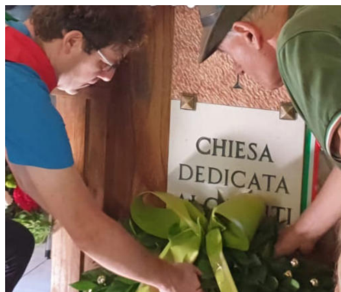
La deposizione della corona all'interno della chiesetta.