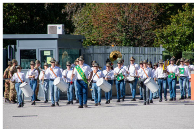
La banda alpina di Gemona.