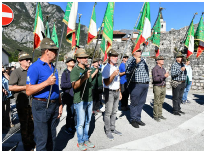
I gagliardetti davanti al cippo che ricorda il Cantiere ANA numero 4.