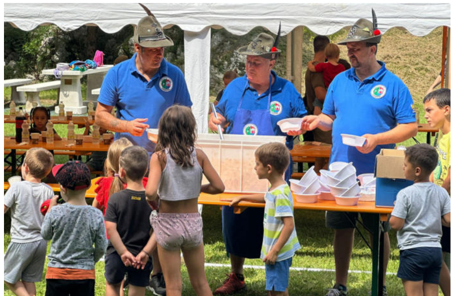
Distribuzione del rancio ai bambini del centro estivo.

ragazzi del centro estivo Venerdì 1° agosto, il Gruppo ANA Venzone, insieme al Gruppo ANA 8° Reggimento Venzone, ha portato un momento di allegria e tradizione al centro estivo organizzato dall'Amministrazione Comunale. Per l'occasione è stato preparato il classico rancio alpino, offrendo ai bambini una gustosa