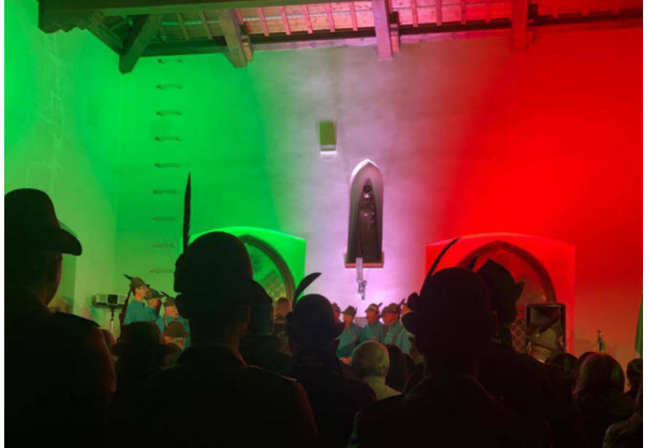
Un momento della manifestazione a Venzone.