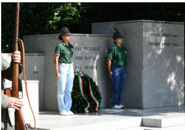
L'omaggio ai caduti del Tolmezzo.