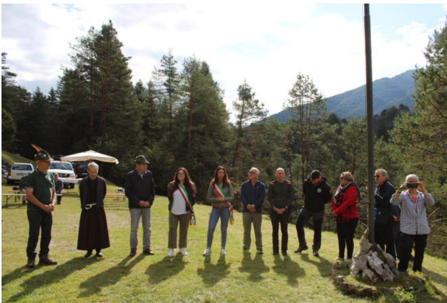
Le autorità intervenute a Malga Amula.