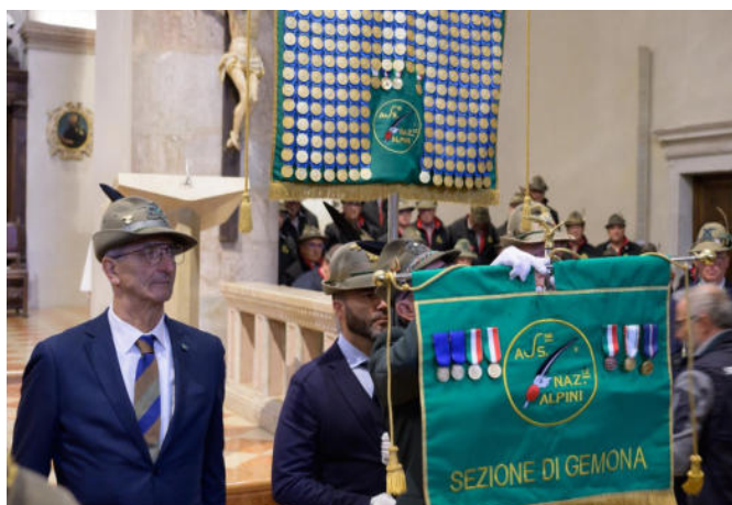
In Duomo, il Medagliere e il nuovo Vessillo della Sezione ANA.