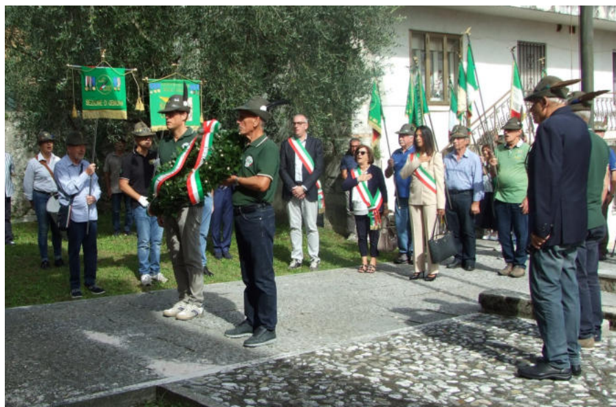
L'Alzabandiera davanti al monumento ai caduti.