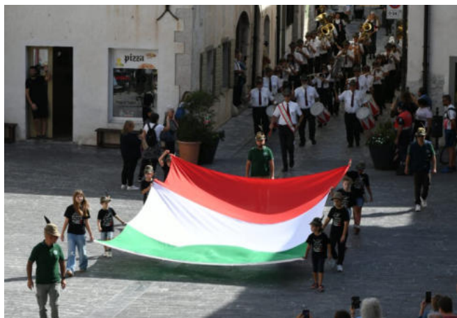
Il grande tricolore portato dai bambini entra in Piazza Municipio.